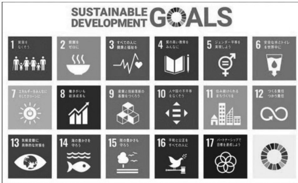
図1. 17の持続可能な開発目標（SDGs）